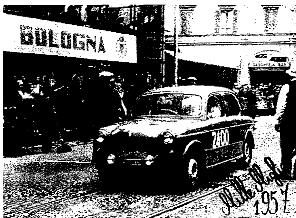
Il veronese Nicola Fabiano su Fiat 1100/103 al passaggio di Bologna nella Mille Miglia 1957